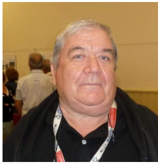
Président du club bivouac Dept 01