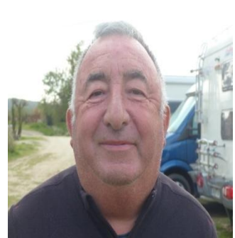
Secrétaire Adjoint Dept 84