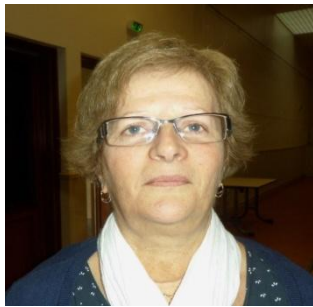
Trésorière adjointe Dept 84