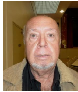
Président d'honneur Espagne