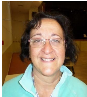
Secrétaire Générale Dept 13