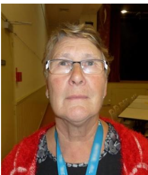
Responsable Voyages Dept 44