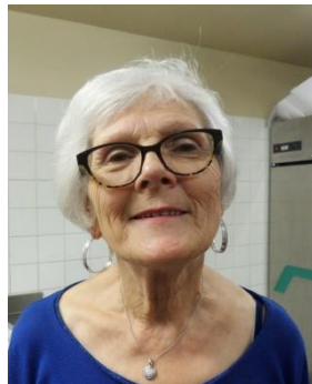
Adj. Resp voyages Dept 35