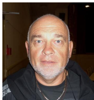
Vérificateurs aux comptes Dep 87