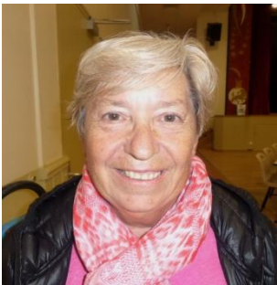
Trésorière Générale Dept 01