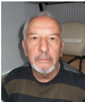
Relations avec FFCC Dep 85